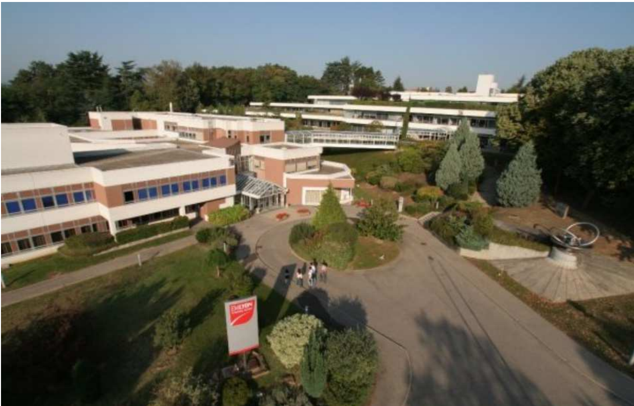
L'école de commerce EM Lyon va quitter le campus d'Ecully pour s'installer dans le quartier de Gerland à Lyon en 2022.

Caroline Girardon | Publié le 16/01/18 à 16h48 — Mis à jour le 16/01/18 à 19h29